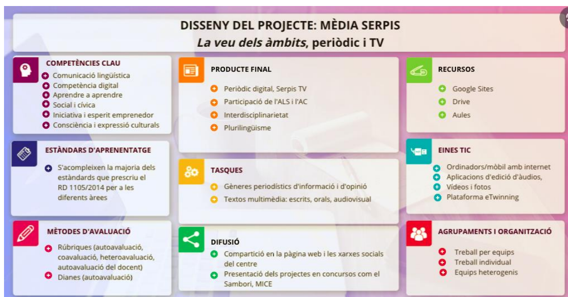
Imatge 4: Esquema del projecte Mèdia Serpis

Plantegem un treball integrat de les llengües mitjançant l'aprenentatge basat en projectes i cooperatiu que culmine en l'elaboració d'un mitjà de comunicació periodístic del centre, Mèdia Serpis: La veu dels àmbits / Serpis Tv . El periòdic i la TV, que es publiquen en un espai web ( Google Sites ), són el producte final que es derivarà d'altres projectes més reduïts inclosos en diferents seccions: protecció del medi ambient i sostenibilitat, alimentació saludables, hort escolar ecològic, pràctica de la lectura en veu alta, foment de la lectura, celebracions culturals i socials, i recerca d'informació sobre temes d'interès. A partir d'eixos xicotets i gran projecte s'organitzarà la proposta que, a grans trets, resumim en el canvas següent: