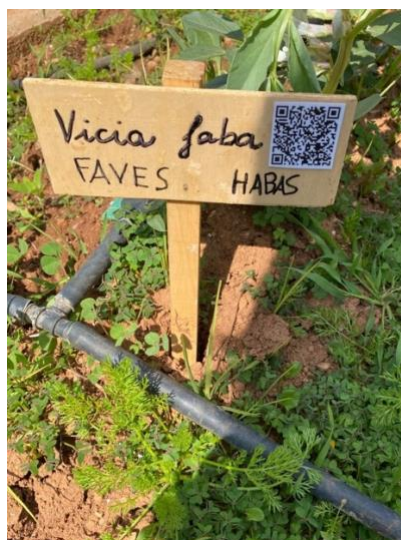
Imatge 10: Cartell de senyalització de l'hort

En el departament de Biologia s'han creat codis QR amb l'explicació de les característiques dels cultius que s'han plantat i s'han afegit als cartells de senyalització que s'han instal·lat en els horts amb els nom en llatí, valencià i castellà de cada planta. El projecte continuarà durant tot el curs ja que l'alumnat i el professorat està molt motivat i ens han concedit el programa L'hort escolar com a eina educativa de l'Ajuntament de València.