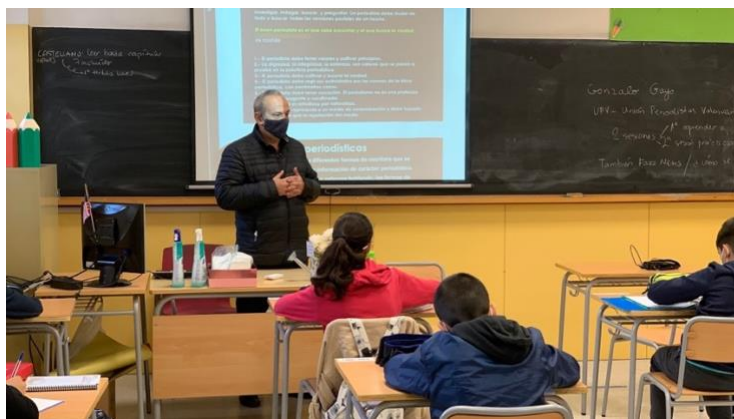
Imatge 9: Taller de premsa

D'altra banda, es va fer un taller de premsa que ens va concedir la Unió de Periodistes del País Valencià, en què un periodista professional va impartir unes classes sobre els gèneres periodístics i les notícies falses. A més, ens va donar una sèrie de recomanacions per a elaborar els articles de Mèdia Serpis .