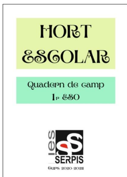
Imatge 9: Portada del quadern de l'hort

Un altre projecte desenvolupat pels dos àmbits i que ha anat creixent durant el curs, amb la participació del tot l'alumnat de 1r d'ESO, ha sigut l'hort escolar. A l'IES Serpis comptem amb nou parcel·les que s'han distribuït entre els diferents grups i una part del professorat de l'àmbit lingüístic-social (ALS) i del científic (AC). En l'ALS es fa el seguiment del treball de l'hort en un quadern, on s'anota el treball realitzat, el lèxic de les faenes, de les eines del camp, de les plantes i dels animalets observats.