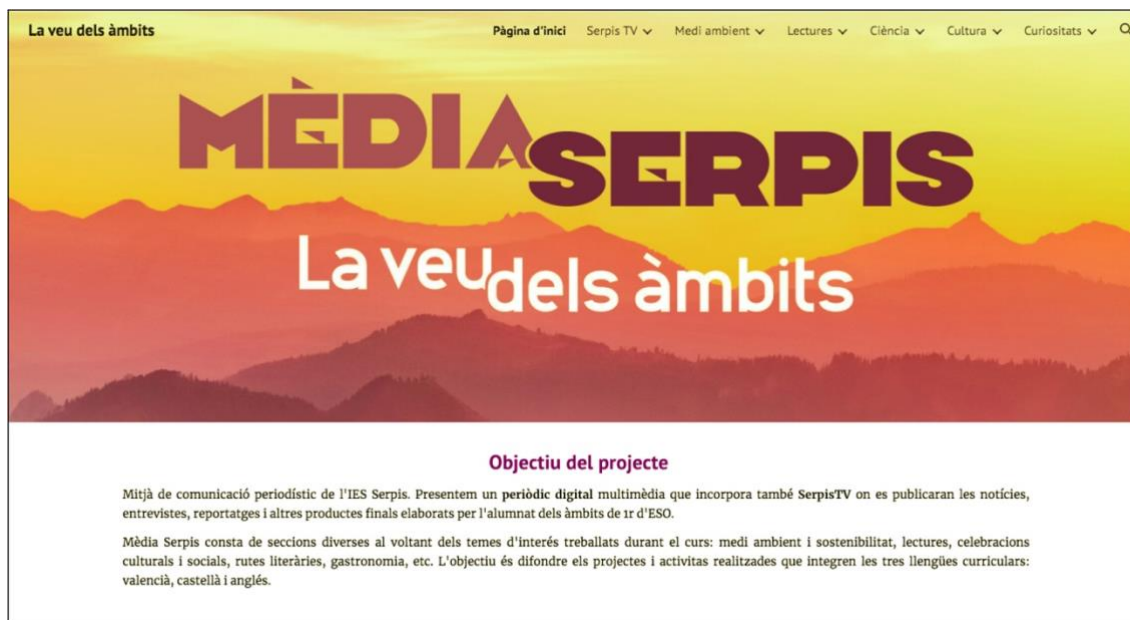
Imatge 1: Portada de Mèdia Serpis

Mèdia Serpis és el mitjà de comunicació periodístic de l'IES Serpis, creat durant el curs 2020/21 amb la introducció dels àmbits en 1r d'ESO. La idea de posar en marxa aquest mitjà audiovisual va sorgir de la proposta del professorat d'iniciar un projecte comú interdisciplinari que permetera la coincidència de les matèries dels àmbits i la possibilitat de compartir recursos i activitats. En el nostre centre, els àmbits estan formats per les matèries de les llengües valencià, castellà i anglés, amb Geografia i Història, en el cas de l'Àmbit Lingüístic i Social (ALS); i per les matèries de Biologia i Geologia, amb Matemàtiques, en l'Àmbit Científic (AC).