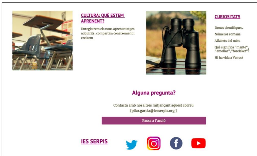
Imatge 3: Seccions i connexió amb les xarxes socials de l'IES Serpis

Un objectiu destacat ha estat també difondre el treball de l'alumnat a tot el centre, a la comunitat educativa, a les famílies i a tots aquells interessats que entren en la web de l'Institut, on s'allotja l'accés a Mèdia Serpis , i que ens segueixquen per les xarxes socials del centre: Twitter, Instagram, Youtube i Facebook