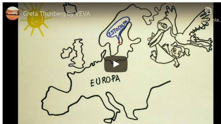
Imatge 8: Bibliotràiler sobre La història de la Greta

Les lectures també es comparteixen en els grups de 1r d'ESO i, per tal de relacionar-les amb els continguts del projecte, llegirem el llibre La història de la Greta. La biografia no oficial de Greta Thunberg . Ed. Estrella Polar. La lectura es va treballar en cercles literaris, realitzant un bibliotràiler i àudios per a comentar-la en una tertúlia, a més de preparar una entrevista amb Greta.