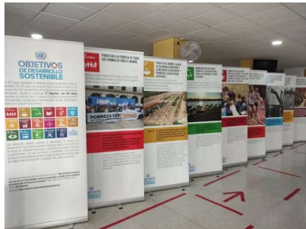
Imatge 6: Cartell de sensibilització