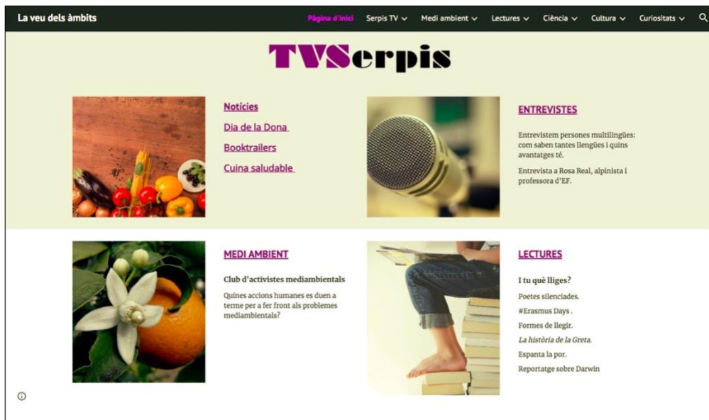
Imatge 2: Seccions de TVSerpis

Un objectiu destacat ha estat també difondre el treball de l'alumnat a tot el centre, a la comunitat educativa, a les famílies i a tots aquells interessats que entren en la web de l'Institut, on s'allotja l'accés a Mèdia Serpis , i que ens segueixquen per les xarxes socials del centre: Twitter, Instagram, Youtube i Facebook